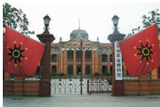
辛亥革命博物馆 1911 Revolution Museum www.1911museum.com