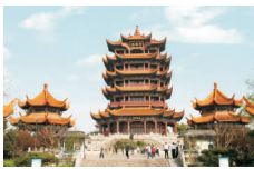
黄鹤楼 Yellow Crane Tower www.cnhhl.com