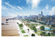
汉口江滩 Hankou Riverside