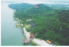
武汉东湖风景区 Wuhan East Lake www.whdonghu.com