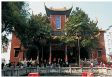
归元寺 Guiyuan Temple www.guiyuanchansi.net