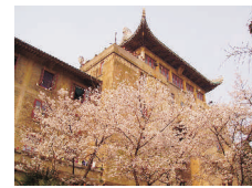
武汉大学 Wuhan University www.whu.edu.cn