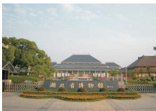
湖北省博物馆 Hubei Province Museum 武昌东湖路156号 Hubei Provincial Museum 156 Donghu Avenue, Wuchang District 027-86794127

160 xudong avenue, wuchang district, wuhan, hubei province, china, 430062