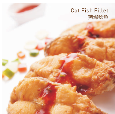
Cat Fish Fillet 煎焗鲷鱼