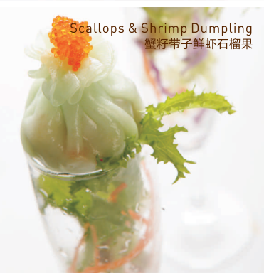
Scallops & Shrimp Dumpling 蟹籽带子鲜虾石榴果