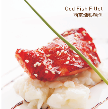
Cod Fish Fillet 西京烧银鳕鱼