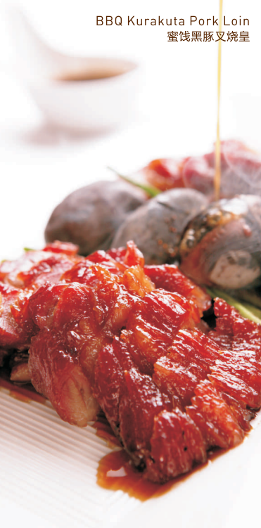
BBQ Kurakuta Pork Loin 蜜饯黑豚叉烧皇