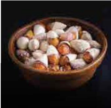
銀杏塩煎り Roasted Ginkgo Nuts, Sea Salt 150 B