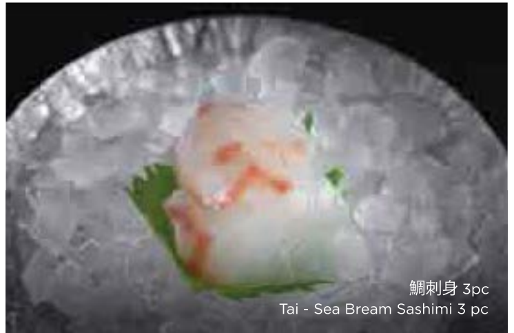
鯛刺身 3pc Tai - Sea Bream Sashimi 3 pc