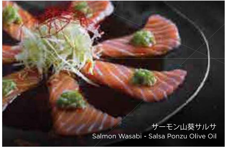
サーモン山葵サルサ Salmon Wasabi - Salsa Ponzu Olive Oil