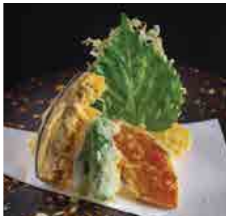
野菜5種天婦羅 5 Kinds of Vegetable Tempura 250 B