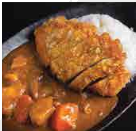
黒豚カツカレー Deep-fried Mature Kurobuta Pork Cutlet Japanese Mild Curry with Rice 400 B