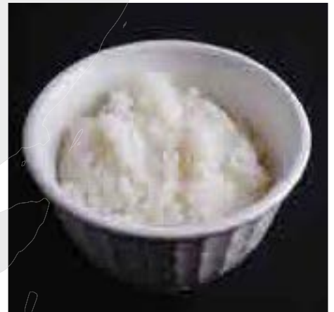
白御飯 Steamed Rice 100 B