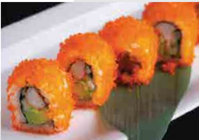
カリフォルニア巻き California Roll (6pc) Avocado, Cucumber, Crab Stick, Tobiko 360 B