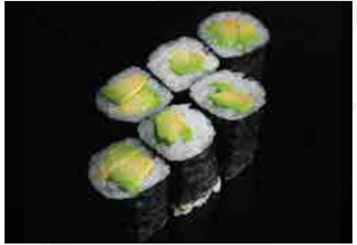
アボカド巻 Avocado Roll 250 B