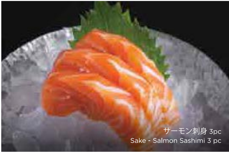
サーモン刺身 3pc Sake - Salmon Sashimi 3 pc