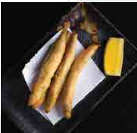
ししゃもから揚げ Shishamo Smelt Fritta 160 B