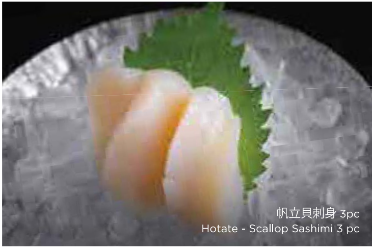
帆立貝刺身 3pc Hotate - Scallop Sashimi 3 pc