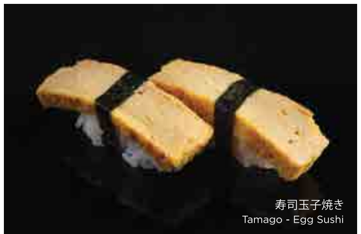
寿司玉子焼き Tamago - Egg Sushi