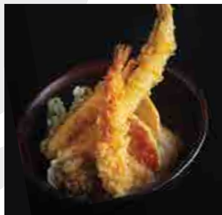
海老と穴子の天丼 Shrimp and Sea Conger Eel Tempura on Rice 600 B