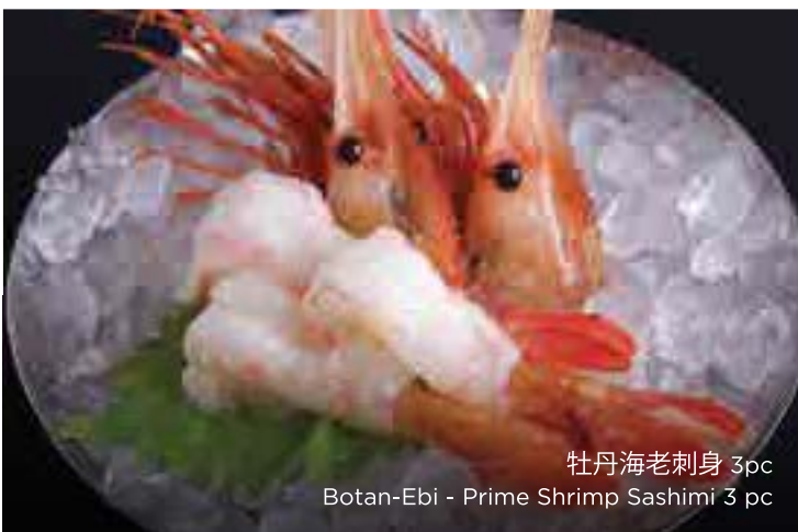
牡丹海老刺身 3pc Botan-Ebi - Prime Shrimp Sashimi 3 pc