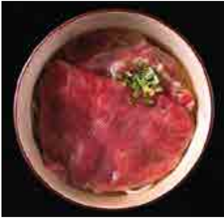
黒毛和牛うどん 又は 蕎麦 Japanese Beef Noodle Himi Udon or Soba 1,100 B