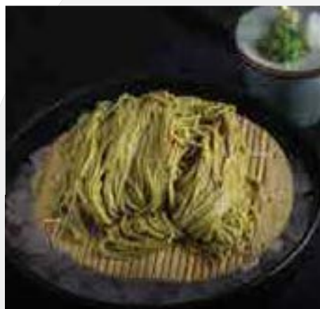
京都宇治の冷茶蕎麦 Kyoto Uji Cold Green Tea Noodles 360 B