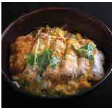
黒豚熟成かつ丼 Deep-fried Mature Kurobuta Pork Cutlet Rice Topped with Egg and Onion Sauce 390 B