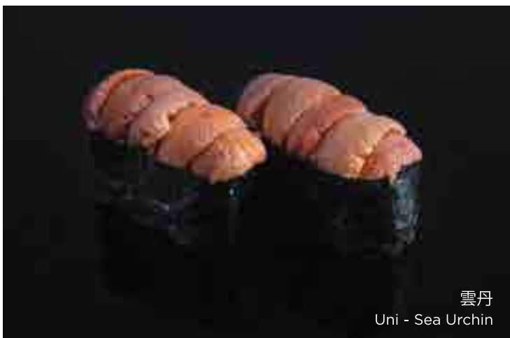
雲丹 Uni - Sea Urchin