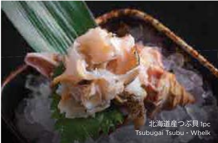
北海道産つづ貝 1pc Tsubugai Tsubu - Whelk