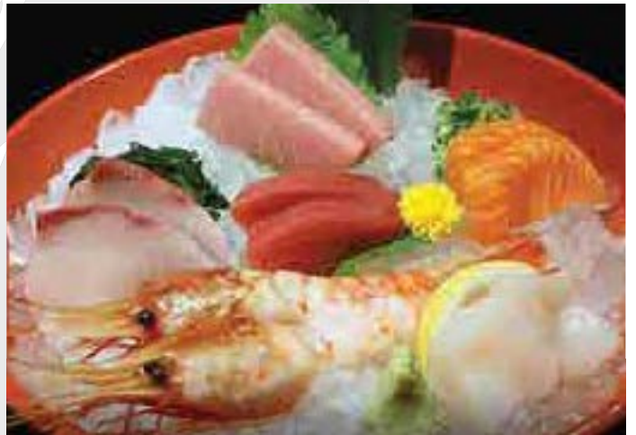
特上刺身 12点盛 Deluxe Sashimi Selection 12 pc 2,800 B