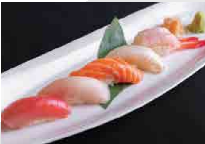
握り寿司 5貫 Sushi Selection 5 pc 850 B