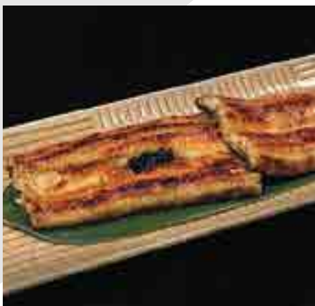
静岡鰻蒲焼 Grilled Japanese Shizuoka Eel 1,700 B