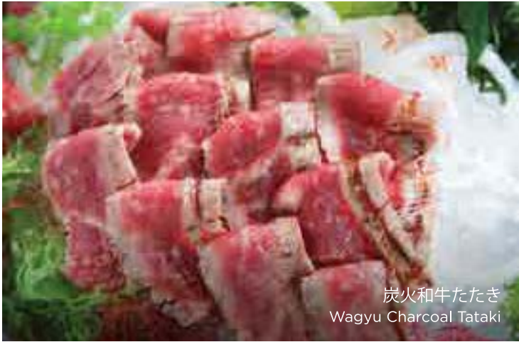
炭火和牛たたき Wagyu Charcoal Tataki