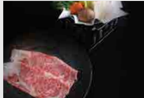
しゃぶしゃぶ Shabu Shabu Mini Pot