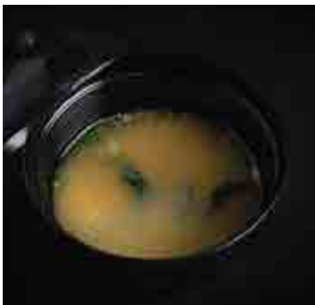
若布と豆腐の味噌汁 Seaweed and Beancurd Miso Soup 130 B