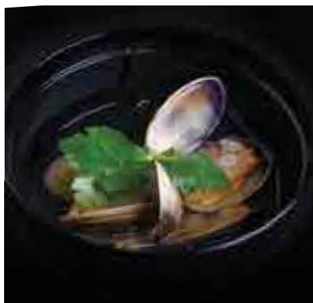
大和浅蜷吸い Asari Clam Clear Soup, Mitsuba Leaves 380 B