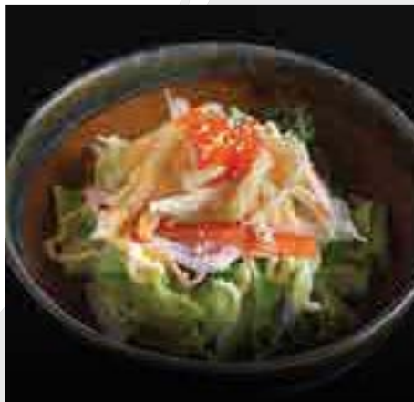
カリカリ白魚サラダ Krispy Shirauo Fish Green Salad with Teriyaki Mayo Sauce 380 B