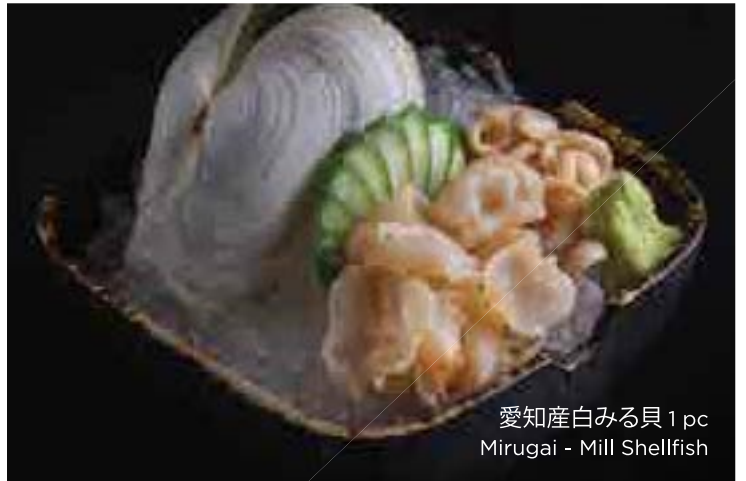
愛知産白みる貝 1pc Mirugai - Mill Shellfish