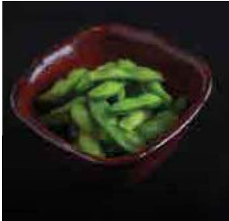
枝豆塩蒸し Steamed Edamame Broad Bean 150 B