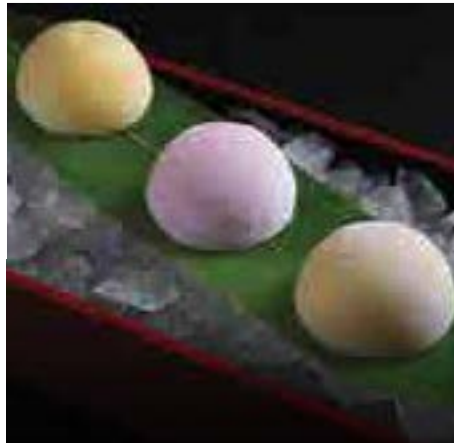
3種餅アイスクリーム Three Different Flavored Rice Cake Ice Cream 170 B