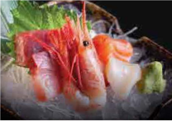
刺身 5点盛 Sashimi Selection 5 pc 750 B