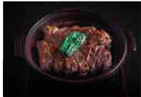
陶板照り焼き Toban Plate Style Steak with Teriyaki Sauce (180g)