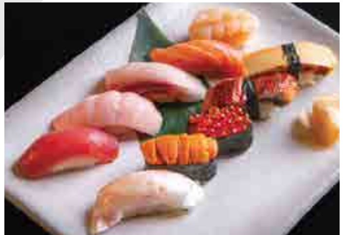
握り寿司 10貫 Sushi Selection 10 pc 2,300 B

魚の鮮度に応じて変更します Subject to change according to the seasonality of the fish