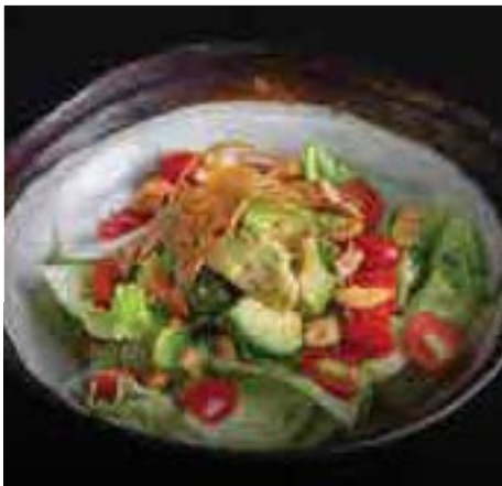
アボガドとトマト グリーンサラダ Avocado and Tomato Fresh Green Japanese Salad 380 B