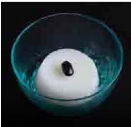
柚子シャーベット Yuzu Sorbet Natural Flavor 200 B