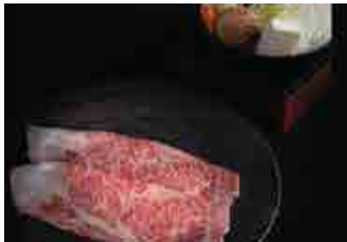
すき焼き Sukiyaki Mini Pot