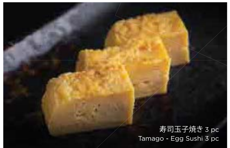
寿司玉子焼き 3 pc Tamago - Egg Sushi 3 pc