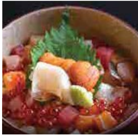
特選海鮮ばらちらし寿司 Prime Mix Bara Chirashi Sushi Rice Bowl 1,400 B