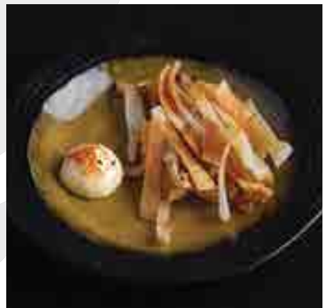
エイヒレ Eihire Roasted Stingray Fin and Chilli Mayonnaise 250 B