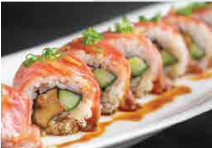
A5佐賀牛フォアグラ 黒胡椒巻き Wagyu Foie Gras Pepper Roll (6pc) A5 Saga Beef, Foie Gras, Black Pepper 1,000 B