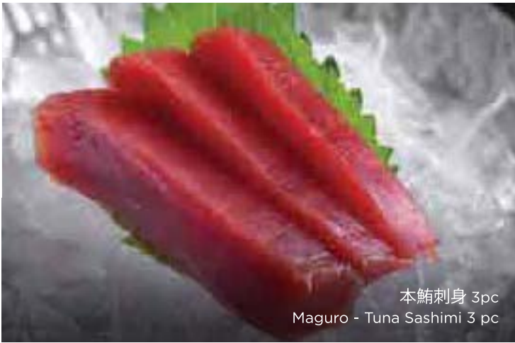
本鮪刺身 3pc Maguro - Tuna Sashimi 3 pc