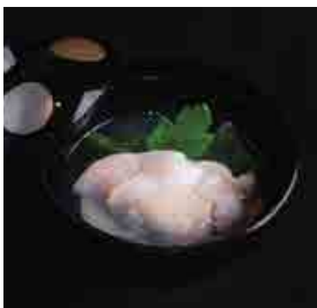
地蛤吸い物 Japanese Hamaguri Clam and Narutowakame Clear Soup 460 B