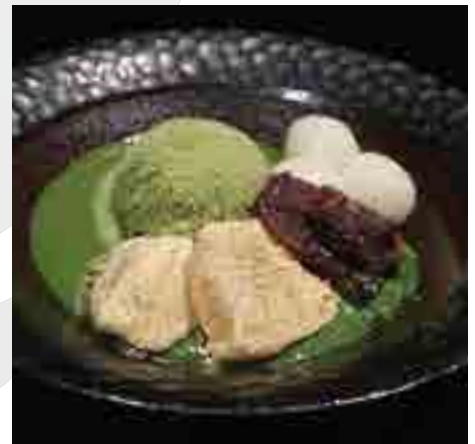
和抹茶パフェ Japanese Matcha Parfait 350 B