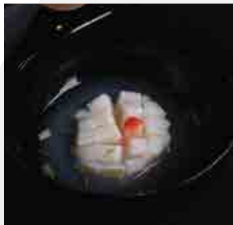
帆立貝葛叩き Hotate Scallop Clear Soup 380 B