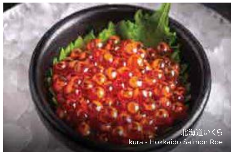
北海道いくら Ikura - Hokkaido Salmon Roe