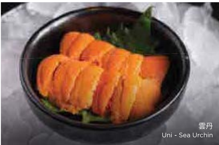
雲丹 Uni - Sea Urchin