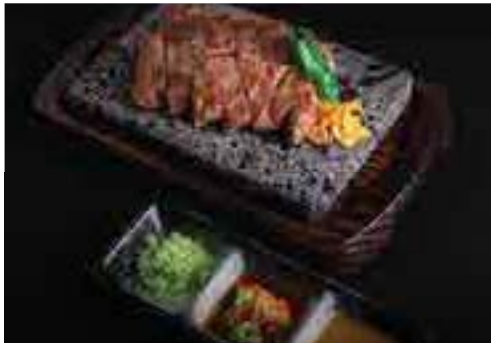
石塩焼き Stone Grilled Steak with Three Kinds of Sauce (180g)