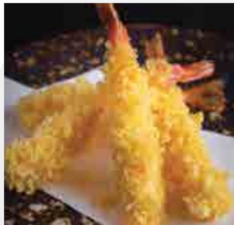
海老天麩羅 (4匹) Tiger Prawn Tempura (4 pc) 350 B