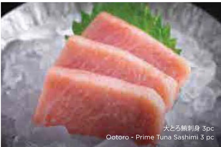
大とろ鮪刺身 3pc Ootoro - Prime Tuna Sashimi 3 pc