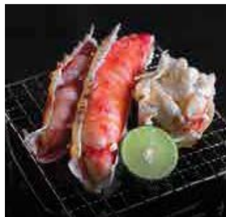
北海道たらば蟹炭火焼き Charcoal Grilled Hokkaido Taraba Crab 500g 3,400 B