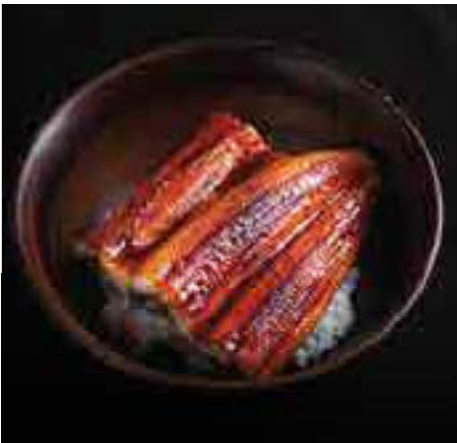
鰻丼 Grilled Eel Sweet BBQ Sauce on Rice 980 B