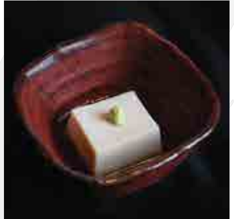
白胡麻豆腐 Homemade White Sesame Tofu, Bonito Soy Sauce 180 B