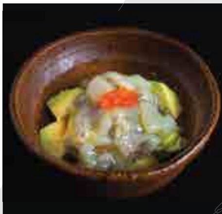
蛸山葵アボガド和え Marinated Octopus and Wasabi, Avocado 280 B