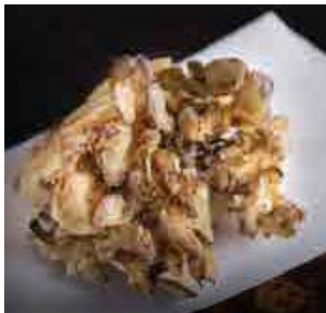
舞茸天婦羅 Maitake Mushroom Tempura 260 B