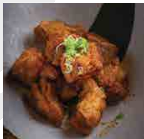
山椒香味鶏唐揚げ Deep-fried Spicy Herb Chicken Thigh 320 B