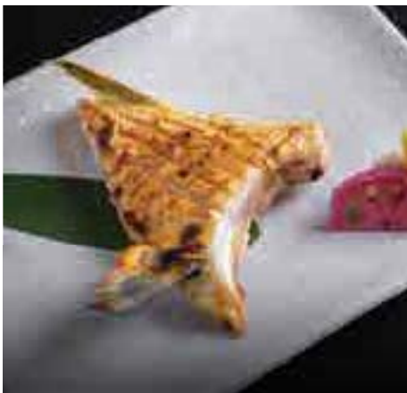
はまちかま塩焼き Grilled Hamachi Kama Shio Yaki 450 B