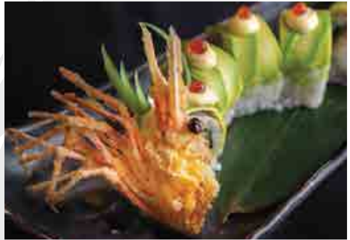
TSUドラゴン巻き TSU Dragon Roll (8pc) King Tiger Prawn Tempura, Eel, Avocado 700 B