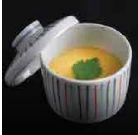
茶碗蒸し Chawanmushi Steamed Egg Custard 150 B