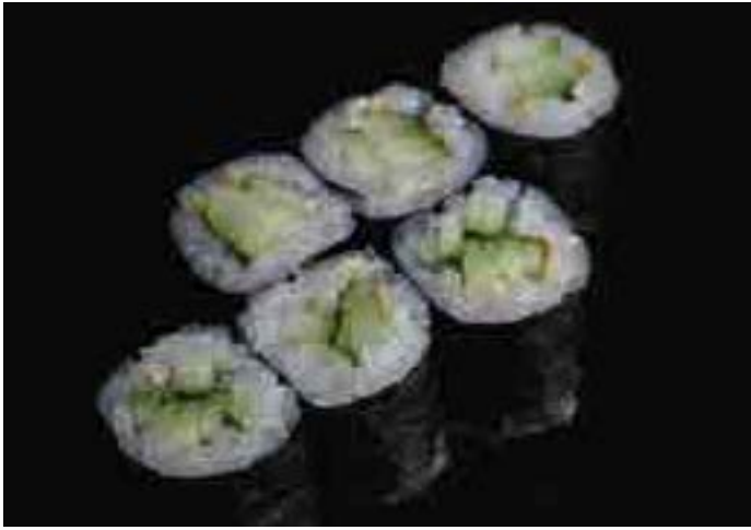
胡瓜巻 Cucumber Roll 250 B