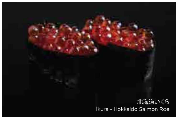
北海道いくら Ikura - Hokkaido Salmon Roe