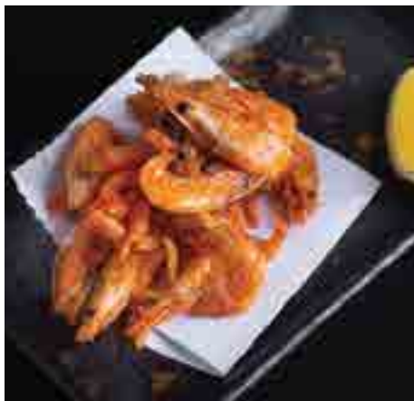
甘海老から揚げ Deep-fried Sweet Shrimp, Lemon 200 B