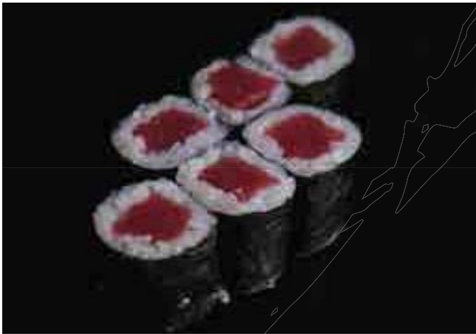
鉄火巻 Tuna Roll 520 B