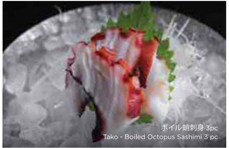
ボイル蛸刺身 3pc Tako - Boiled Octopus Sashimi 3 pc