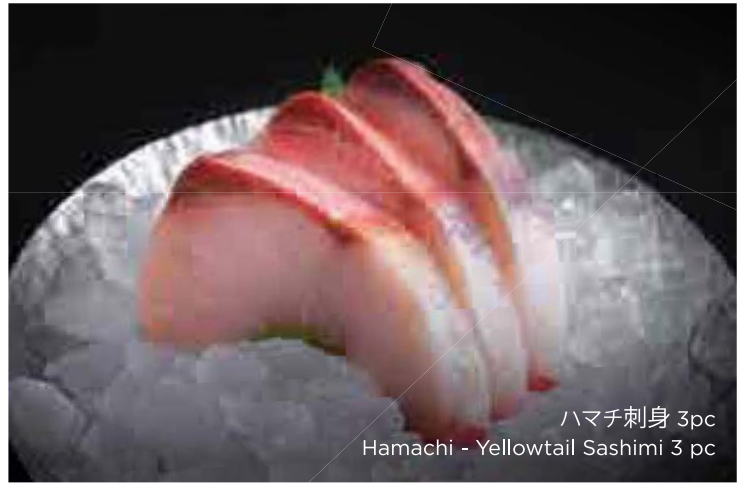
ハマチ刺身 3pc Hamachi - Yellowtail Sashimi 3 pc