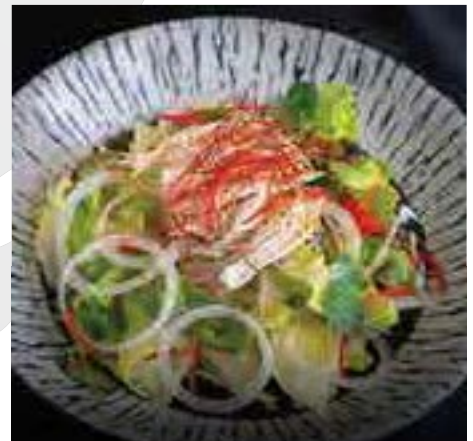
スパイシーチキン ポン酢サラダ Spicy Chicken Breast Coriander Salad with Chill Pons Vinegar Sauce 380 B