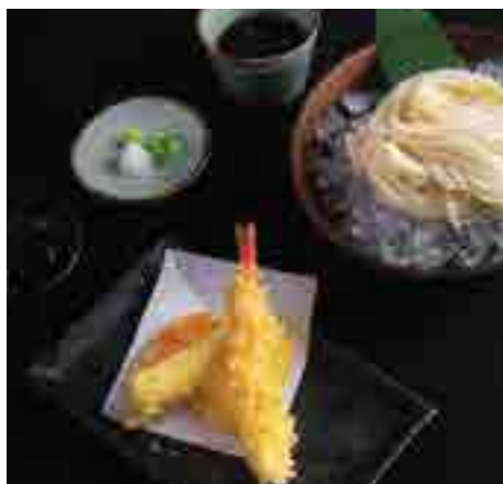
天海老氷見鰻 又は ざる蕎麦 Shrimp Tempura Choice of Cold Udon, Cold Soba Noodles 300 B