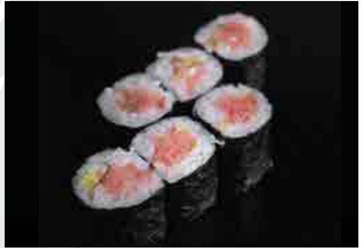
葱とろ巻き Negitoro Roll 680 B