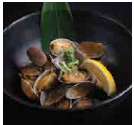
浅利ガーリックバター Japanese Asari Garlic Butter Yaki 250 B