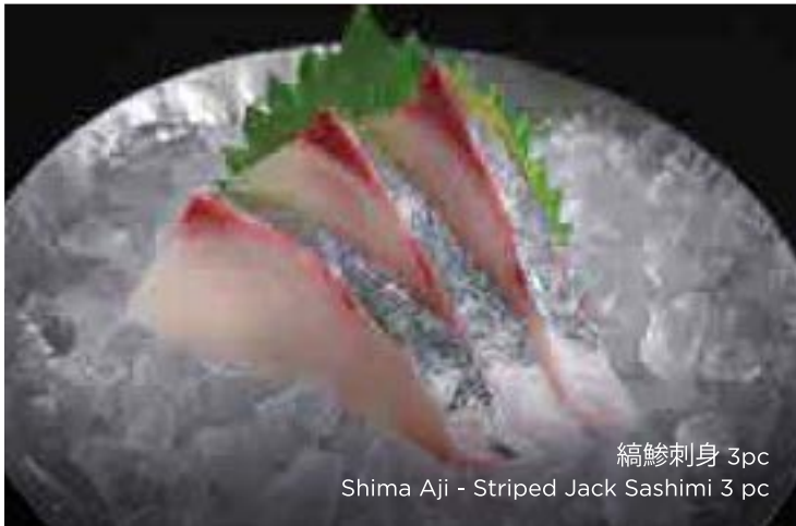
縞鯨刺身 3pc Shima Aji - Striped Jack Sashimi 3 pc