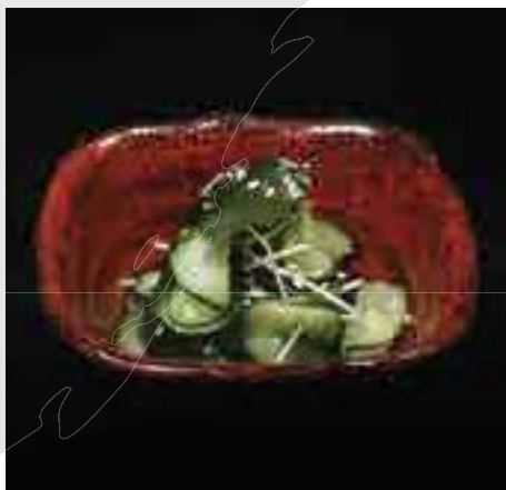
鳴戸若布 胡瓜サラダ Naruto Wakame, Tosa Vinegar Sauce Salad 270 B