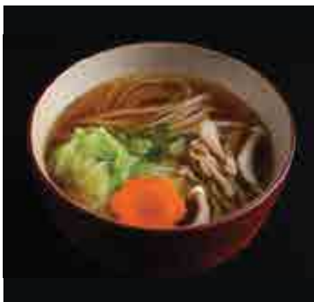
野菜温氷見鰻 又は 蕎麦 Seasonal Vegetable Choice of Hot Himi Udon, Hot Soba Noodles 300 B