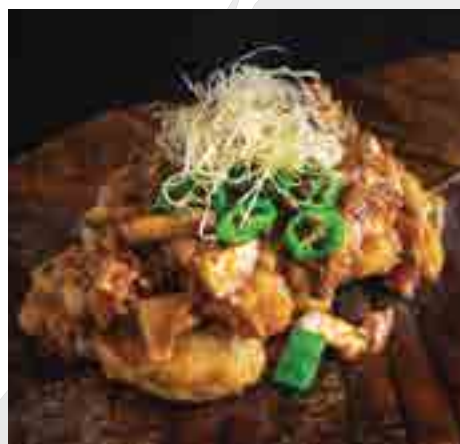
牡蠣朴葉焼き Deep-fried Oyster in Houba Leaf with Miso Paste 500 B