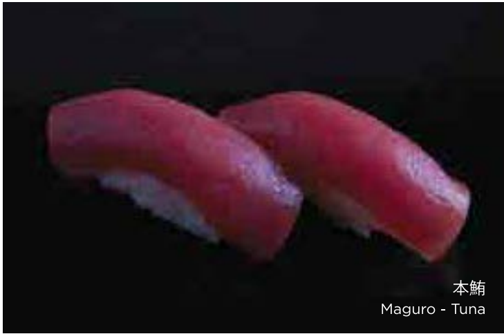
本鮪 Maguro - Tuna