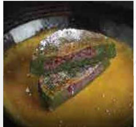
自家製蓬おやき Homemade Yomogi Red Bean Mochi 2pc 180 B