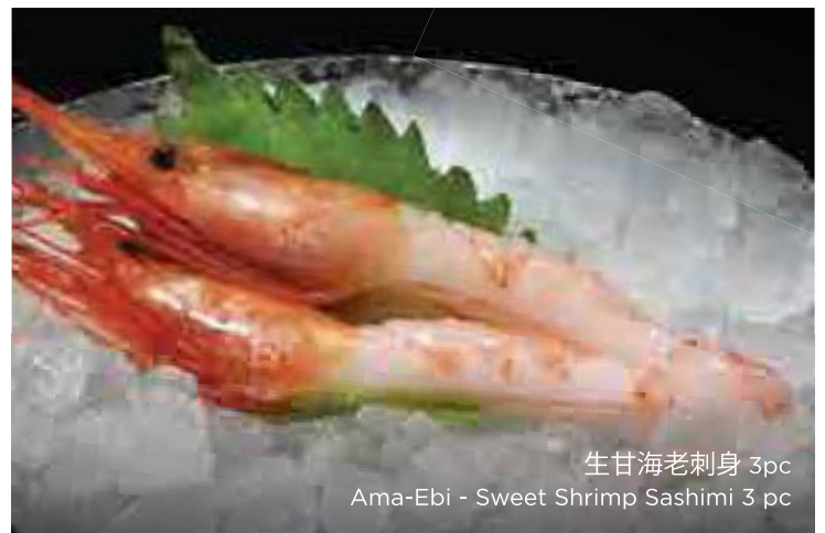
生甘海老刺身 3pc Ama-Ebi - Sweet Shrimp Sashimi 3 pc