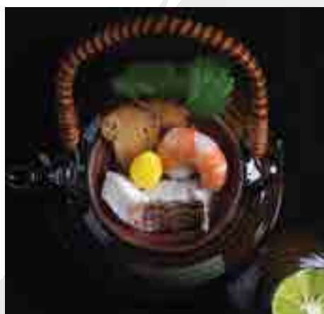
松茸土瓶蒸し Matsutake Mushroom Tea Pot Clear Soup 620 B