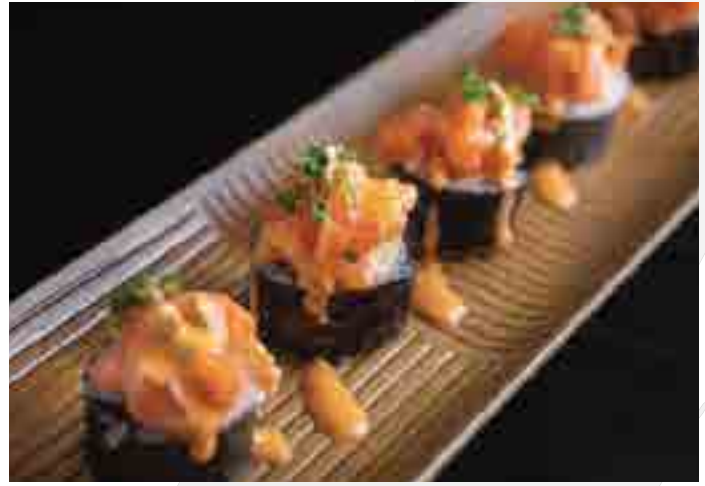
スパイシー鮪又はサーモン巻き Spicy Tuna or Spicy Salmon Roll (5pc) 420 B