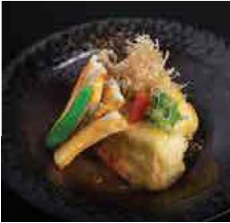
江戸前アナゴ一杯醤油焼き揚げ 出し豆腐 Grilled Sea Conger Eel and Deep-fried Tofu 400 B