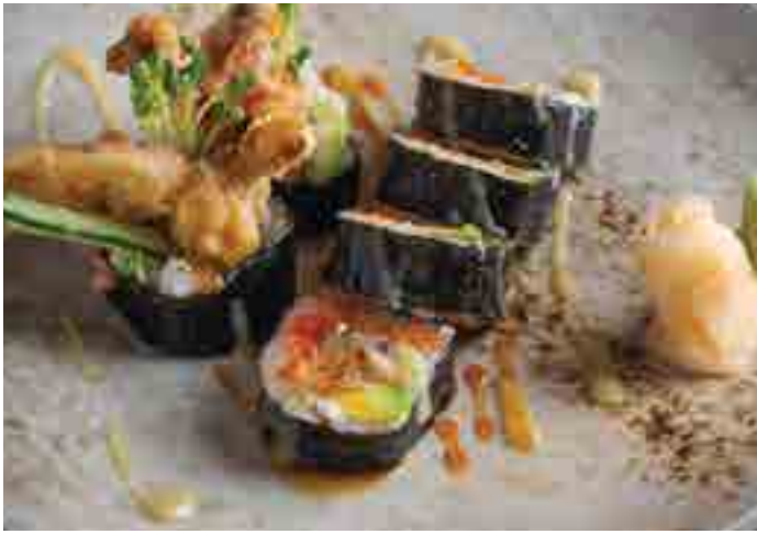
ソフトシェルクラブ巻き Deep-fried Soft Shell Crab Roll (6pc) Crispy Fried Soft Shell Crab, Cucumber, Sesame and Teriyaki Sauce 400 B