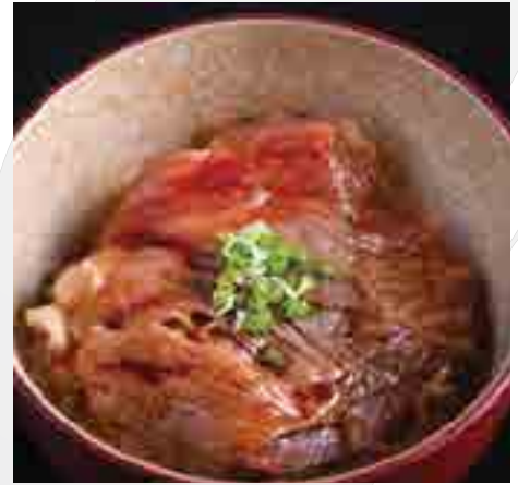
A4佐賀牛丼 A4 Saga Japanese Sliced Beef on Rice with Onion 1,100 B