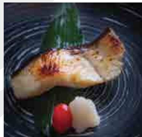
銀鱈祐庵西京焼き Grilled Miso Marinated Silver Cod Fish 560 B