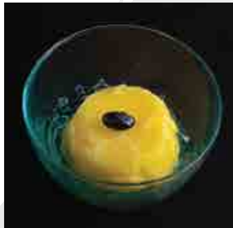
日本みかんシャーベット Japanese Orange Sherbet 200 B