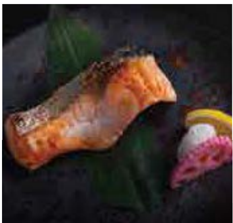
サーモン塩焼き又は照り焼き Grilled Salmon with Salt or Teriyaki 380 B