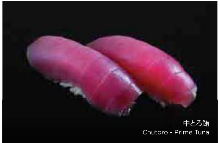
中とろ鮪 Chutoro - Prime Tuna