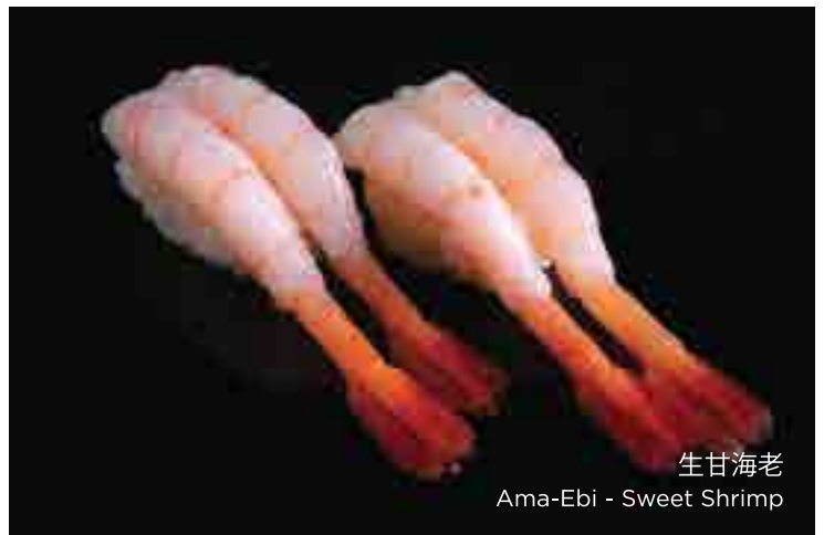
生甘海老 Ama-Ebi - Sweet Shrimp