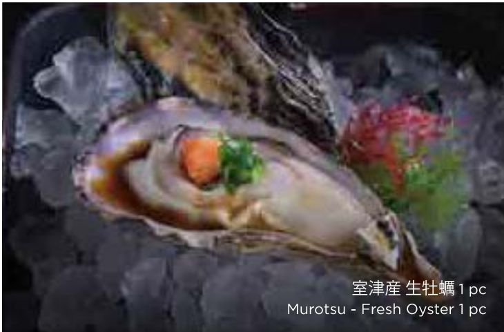
室津産 生牡蠣 1pc Murotsu - Fresh Oyster 1 pc