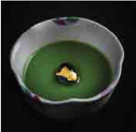
宇治抹茶プリン Uji Green Tea Pudding 130 B