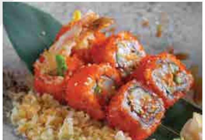
海老天クランチ巻き Crunchy Roll (6pc) Shrimp Tempura, Cucumber, Shiso Leaf 680 B