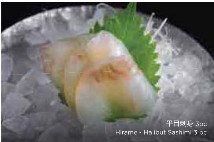
平目刺身 3pc Hirame - Halibut Sashimi 3 pc