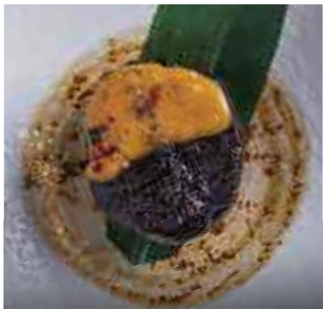
茄子田楽二種味噌焼き Grilled Eggplant, White and Red Miso Paste 230 B