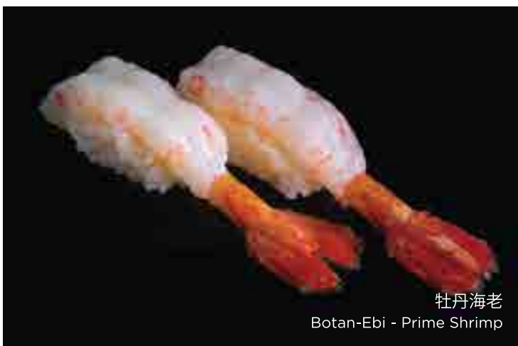
牡丹海老 Botan-Ebi - Prime Shrimp