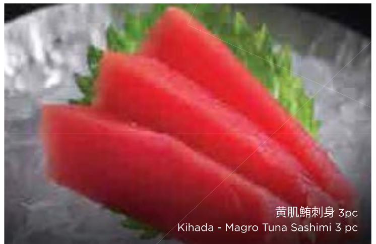
黄肌鮪刺身 3pc Kihada - Magro Tuna Sashimi 3 pc