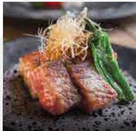
石焼きA4佐賀牛味噌焼き80g Stone Grilled A4 Saga Rib Eye 80g Original Miso Paste 1,000 B