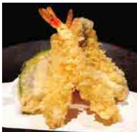
天麩羅盛合せ Tiger Prawn, Sea Conger Eel, Seafood and Vegetable Tempura 440 B