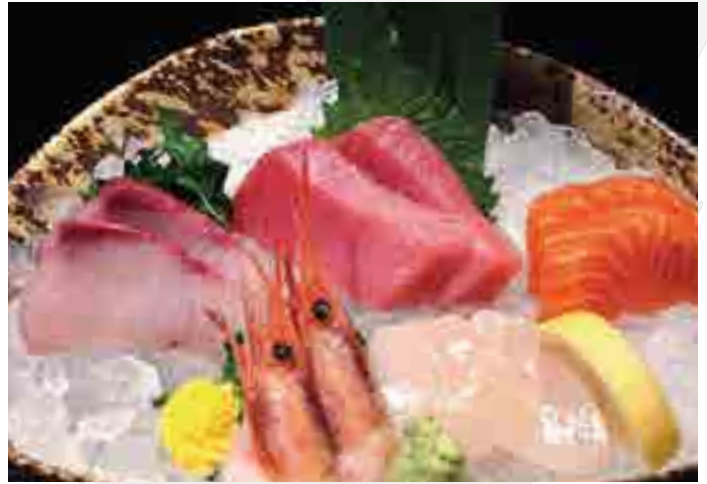
刺身 10点盛 Sashimi Selection 10 pc 1,500 B