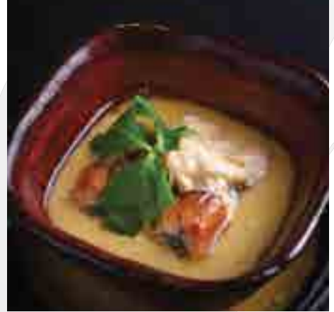
鰻とろ湯葉玉蒸し 柚子餡 葉三つ葉 Simmered Eel and Soy Bean Curd Skin with Egg, Yuzu Sauce 420 B