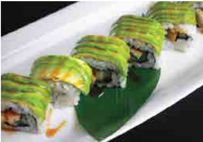
鰻アボガド巻き Unagi Avocado Roll (6pc) Grilled Eel, Cucumber, Avocado 500 B