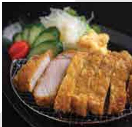
黒豚熟成とんかつ Deep-fried Mature Kurobuta Pork Cutlet 380 B