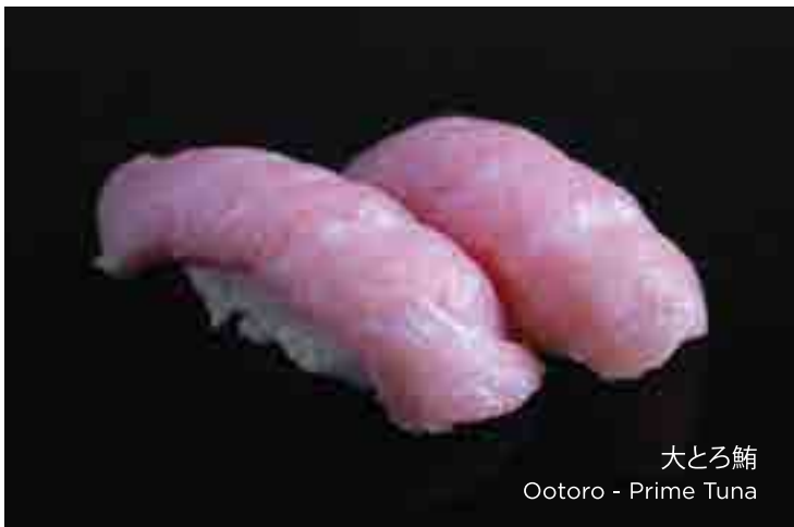
大とろ鮪 Ootoro - Prime Tuna