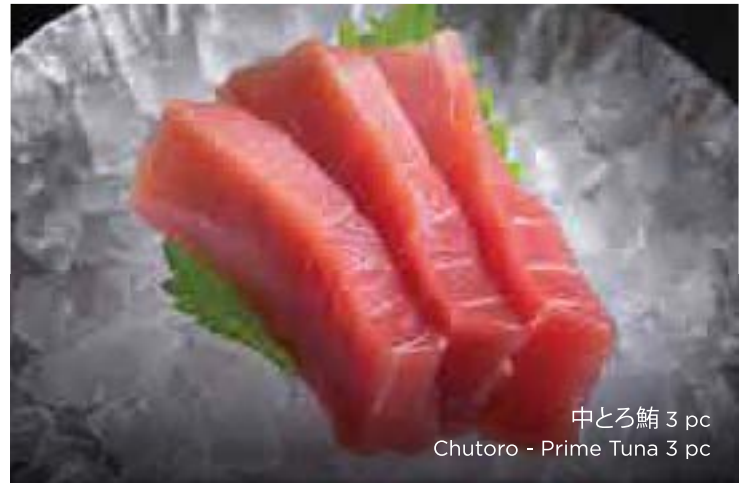
中とろ鮪 3 pc Chutoro - Prime Tuna 3 pc