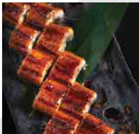
鰻蒲焼 Grilled Eel Sweet BBQ Sauce 980 B